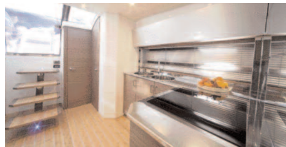
Sopra, le due fasi di trasformazione della dinette nel quadrato, di giorno ampi spazi conviviali e di notte un terzo cabina. A fianco la cucina a murata

piattaforma di costituire un vero e proprio network, in cui i vari strumenti si scambiano reciprocamente le informazioni in tempo reale. Il radar Simrad DX42S con monitor da 18 pollici viene interfacciato al pilota automatico che sfrutta anche le informazioni provenienti dal GPS. Completano il quadro un plotter e l'ecoscandaglio. Unico elemento fuori dal network è l'impianto stereo, di marca Sony. Due ampi passaggi laterali, consentono di raggiungere la tuga, attrezzata a prendisole.