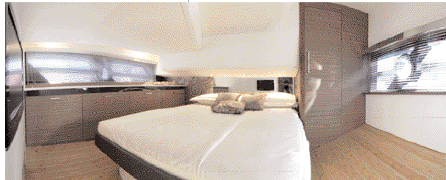
Sopra, una panoramica della cabina di poppa posta a tutto baglio; le due finestre Open-View sulle murate danno all'ambiente un grande apporto di luce naturale. A fianco, il bagno della cabina di prua

da. A dritta, in posizione avanzata, la plancia di comando, con la tradizionale poltrona Rio per pilota e copilota. In plancia troviamo una dotazione di strumenti davvero completa, tutta fornita dallo stesso produttore (SIMRAD). Vengono così sfruttate le evolute capacità della