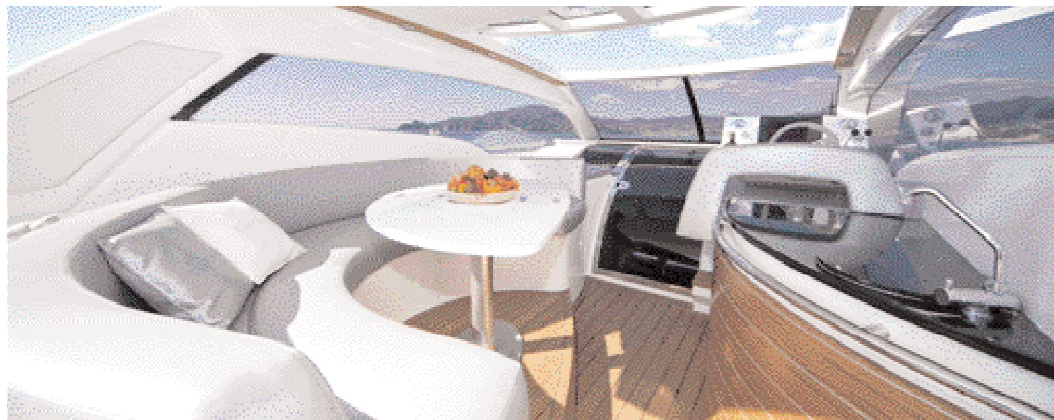
In alto il living semicoperto dall'hard-top apribile. Le forme arrotondate degli arredamenti lo rendono particolarmente elegante