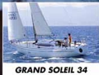
GRAND SOLEIL 34