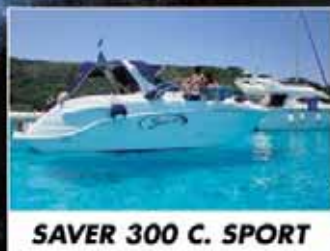
SAVER 300 C. SPORT