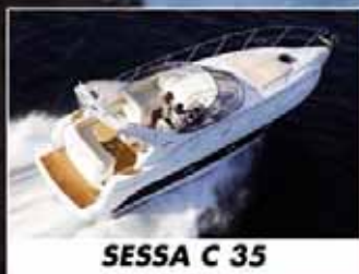
SESSA C 35