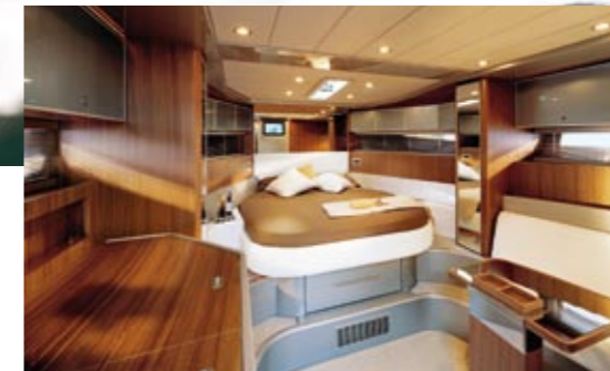
Rivarama Super Lunghezza f.t. 13,40 m Larghezza 3,88 m Motorizzazioni 2 x Man RS 800 hp Velocità max 41 nodi