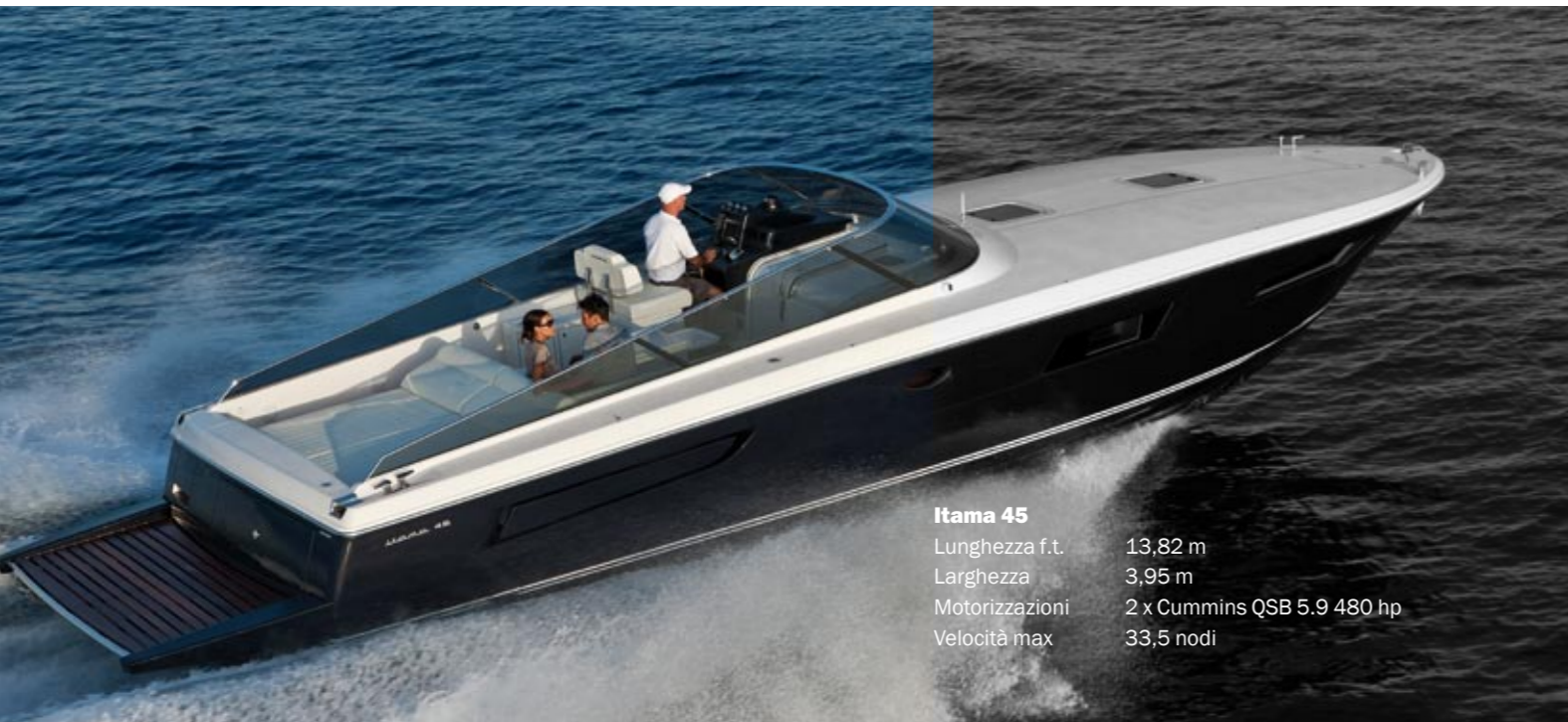
Itama 45 Lunghezza f.t. 13,82 m Larghezza 3,95 m Motorizzazioni 2 x Cummins QSB 5.9 480 hp Velocità max 33,5 nodi

Evoluzione contemporanea del celebre “Forty” e dell’altrettanto apprezzato 38’, il nuovo 45’ di “casa” Itama (Gruppo Ferretti • itama-yacht.com ) rappresenta al meglio le idee, i progetti, la filosofia del Cantiere. Fascino, anima sportiva, stile italiano e – soprattutto – contatto ravvicinato, intimo, con il mare. Linea filante, geometria essenziale e, naturalmente, l’abituale carena a V profonda per una “tenuta” che non conosce rivali. Bianco e blu sono come sempre i colori predominanti “dentro” e “fuori” a colpi di legno laccato, teak, veneziane che si integrano con il “solito” blu della plancia per dare maggiore luminosità e ariosità a tutti gli ambienti. Come al solito l’ospite più gradito, da queste parti, è il mare. Mare Itama.