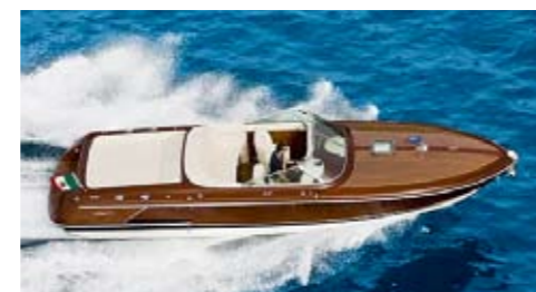
Romance 32 368.000 euro

Ispirato alla tradizione del cantiere, propone linee eleganti e alte prestazioni. Sul prezzo si sente il peso della configurazione degli optional: tutti quelli principali vengono forniti già di base dal cantiere.