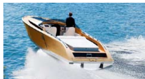
Frauscher 909 244.960 euro

È la barca che più si avvicina a quella della prova per estetica, anche se ha prestazioni più elevate e una carena più "corsaiola". Il design è curatissimo e i dettagli sottolineano la costruzione di alto livello.