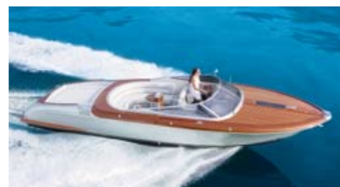
Aquariva super 538.000 euro

È la barca che più si avvicina a quella della prova per estetica, anche se ha prestazioni più elevate e una carena più "corsaiola". Il design è curatissimo e i dettagli sottolineano la costruzione di alto livello.